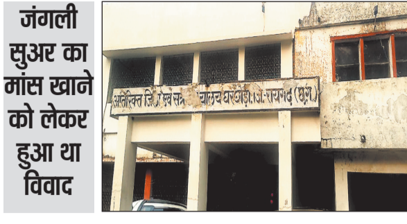
जंगली सुअर का मांस खाने को लेकर हुआ था विवाद